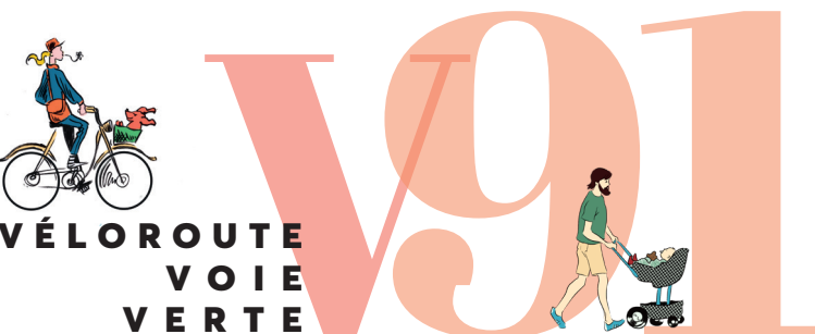
3. Ville de Creysson